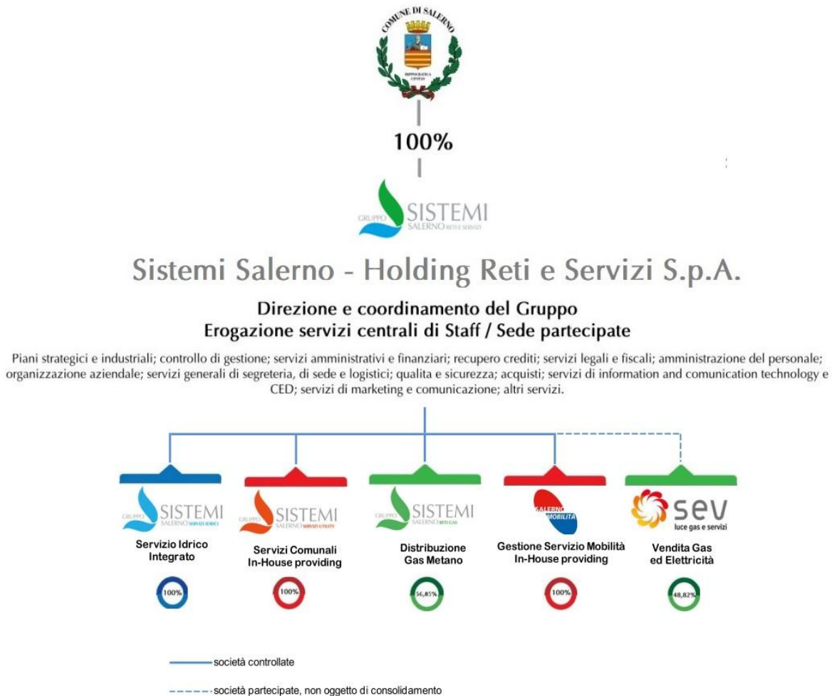
Tab. 1 – Rappresentazione grafica delle Società controllate e partecipate da Sistemi Salerno - Holding Reti e Servizi S.p.A.